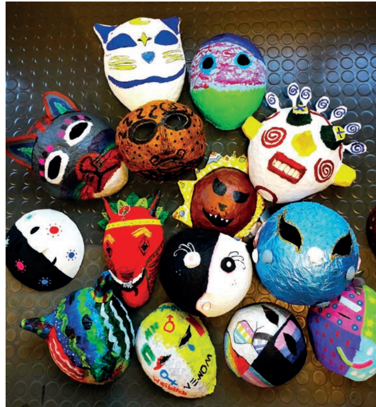
Masken aus dem Unterricht des 8. Jahrgangs, Gymnasium Burgdorf