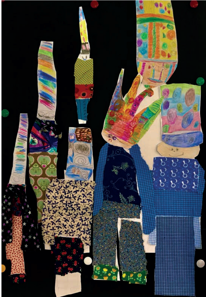
Menschen mit Hüten nach Hundertwasser; Stoffcollage.