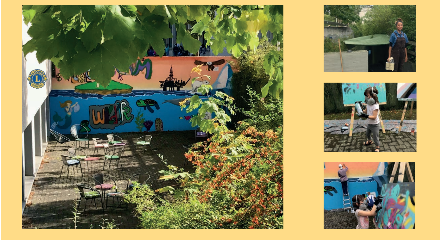
Sommerschule: Thema Nachhaltigkeit - Der Mensch und seine Umwelt; Technik: Graffiti; Alter: von 5 bis 19 Jahren

BNE-Akteur der Deutschen UNESCO-Kommission