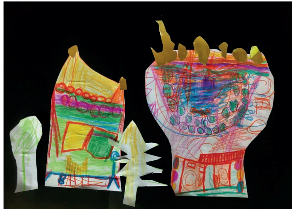
Zuhause geborgen; Collage, Buntstifte.

BNE-Akteur der Deutschen UNESCO-Kommission