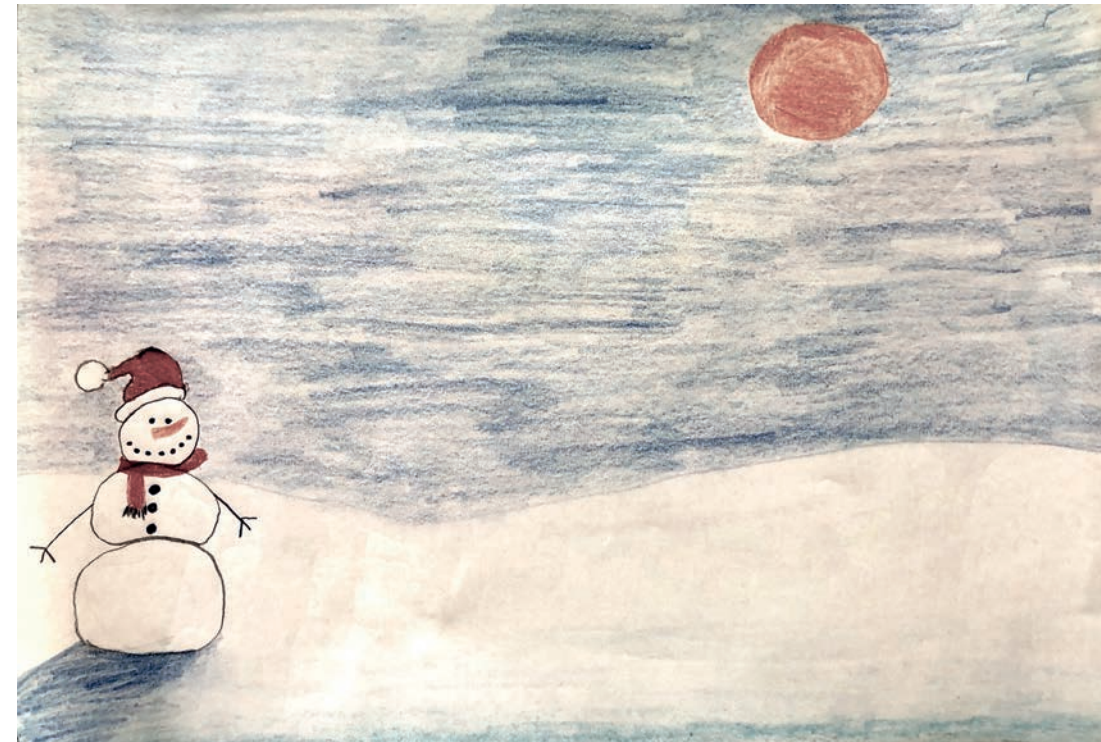
Thema: Winter-Weihnacht; 7. Jahrgang Gymnasium Burgdorf