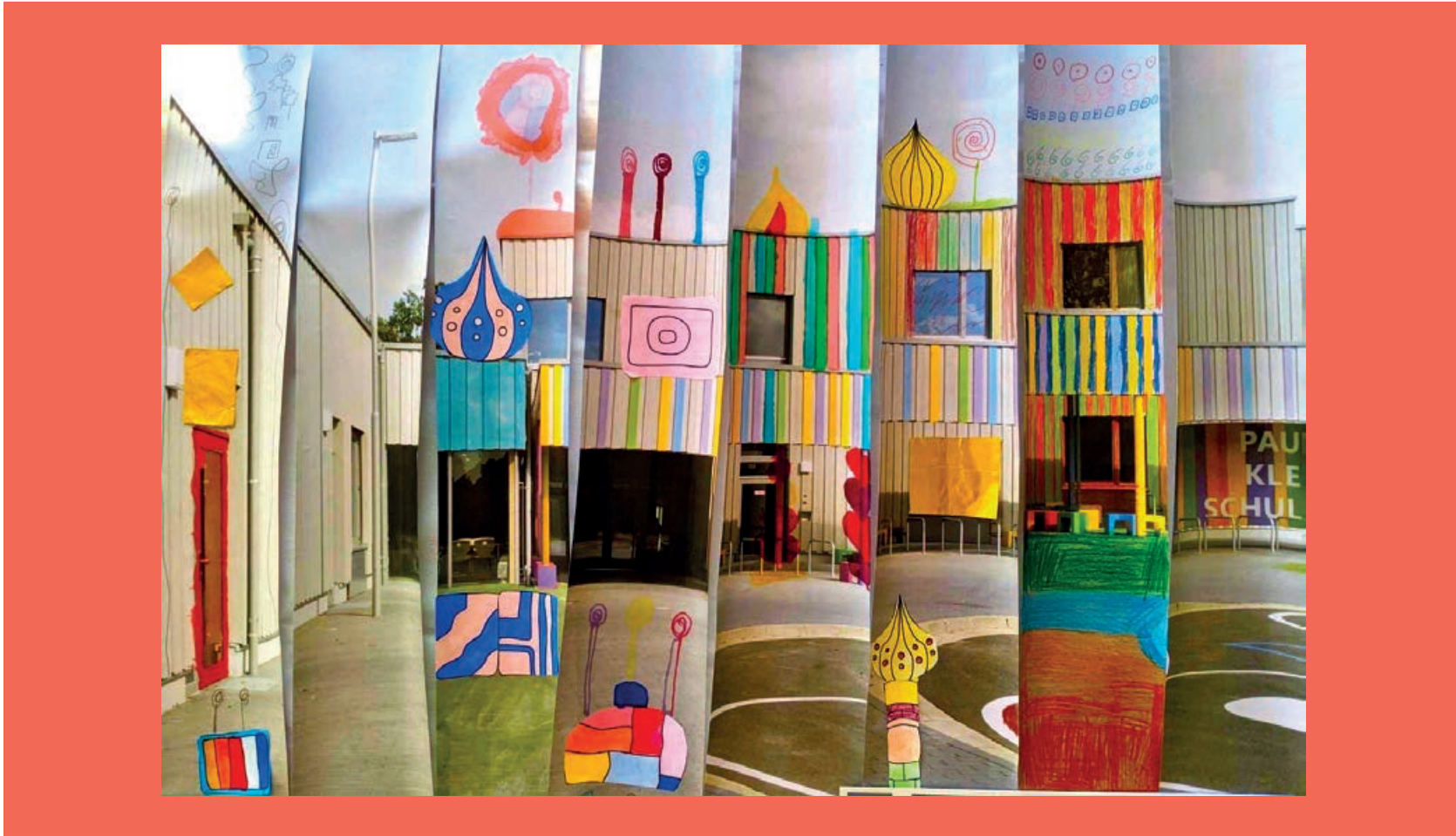
Thema: Paul-Klee-Schule als Hundertwasserbau; Collage; Koloration durch Filzstifte. 5. Jahrgang

BNE-Akteur der Deutschen UNESCO-Kommission