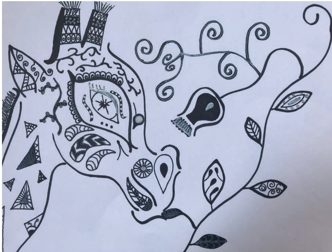
Ornamentales Bild - Grafik: Tattoo-Vorlage Giraffe; von Lara-Zofia Lodzig, 10. Jahrgang

BNE-Akteur der Deutschen UNESCO-Kommission