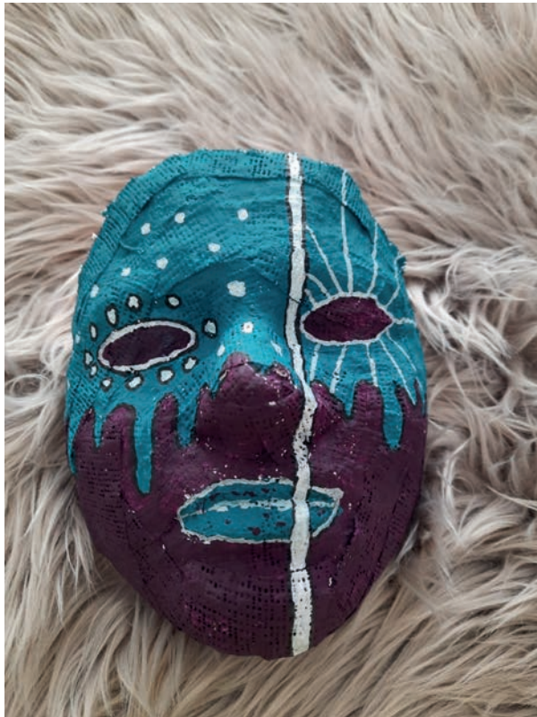
von: Elin Röhrlich

BNE-Akteur der Deutschen UNESCO-Kommission