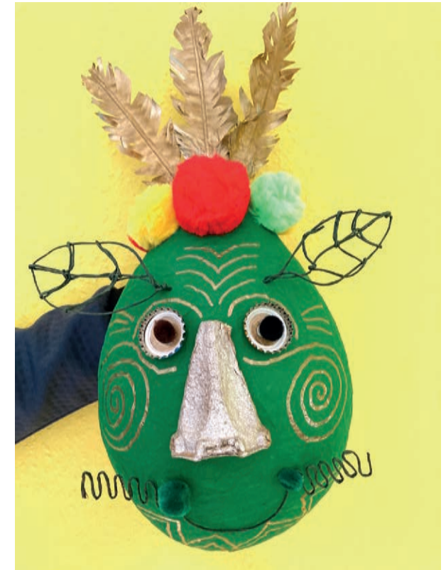
von: Jim Bußmann