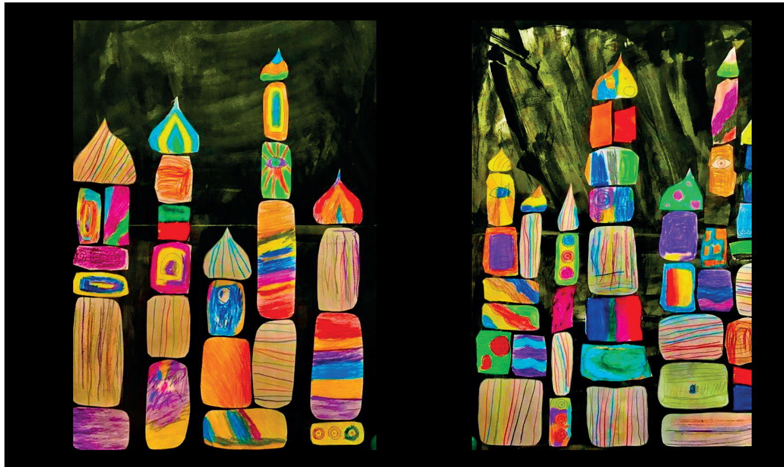
Thema: Hundertwasserhäuser, 5. Jahrgang; Paul-Klee-Schule, Celle

BNE-Akteur der Deutschen UNESCO-Kommission